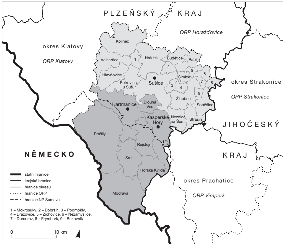
Obr. 1 – Sušicko. Vnitrozemské obce – světle šedě, pohraniční obce – tmavě šedě.

(centrem) Sušicí a hranicí Plzeňského a Jihočeského kraje (Nezdice, Strašín, Žihobce, Frymburk) a (3) podél hranice ORP Sušice a ORP Horažďovice (blíže viz např. Brabec 2002; Musil 1988; Musil, Müller 2008).