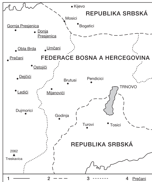
Obr. 2 – Lokality výzkumu Dejčići. Vysvětlivky: 1 – hranice opštiny, 2 – interetnitní hranice, 3 – hranice mjesne zajednice, 4 – lokality výzkumu.

UNHCR uvádí, že se do října roku 2006 vrátilo do federální opštiny Trnovo celkem 225 Srbů, což je úspěšnost 42,8 %. Dle samotného úřadu opštiny Trnovo, který monitoruje na svém prostoru 98 Srbů v roce 2006, je ale úspěšnost minoritní návratnosti Srbů pouze 18,6 %. Pokud se podíváme konkrétně na návratnost do zkoumané mjesne zajednice Dejčići shledáme, že dle úřadu opštiny byla úspěšnost návratnosti Srbů 14 %, dle mého vlastního průzkumu však jde o pouhých 3,33 % (monitoroval jsem zde reálnou návratnost pouze 5 Srbů). Je to také největší zaznamenaný rozpor mezi mými daty (3,33 %) a daty UNHCR (42,8 %). V tabulce 1 a na obrázku 3 jsou zobrazeny rozdíly v odlišném vidění etnické situace v prostoru federální opštiny Trnovo. 19