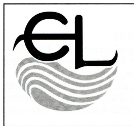
Obr. 3 – Logo Euroregionu Elbe/Labe

cím obyvatele i instituce na vstup do EU (vč. informací o podpůrných programech EU) bylo založení Euro Centra Ústí n. L. počátkem roku 1999.