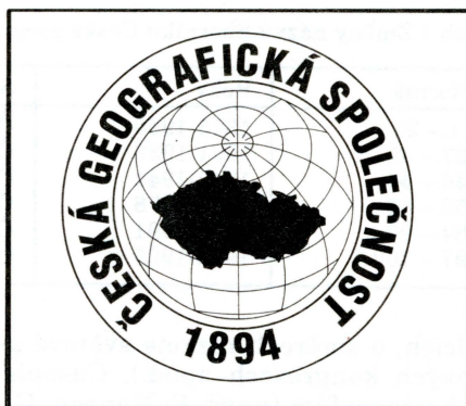
Obr. 4 – Znak České geografické společnosti z titulní strany Sborníku ČGS v roce 1993