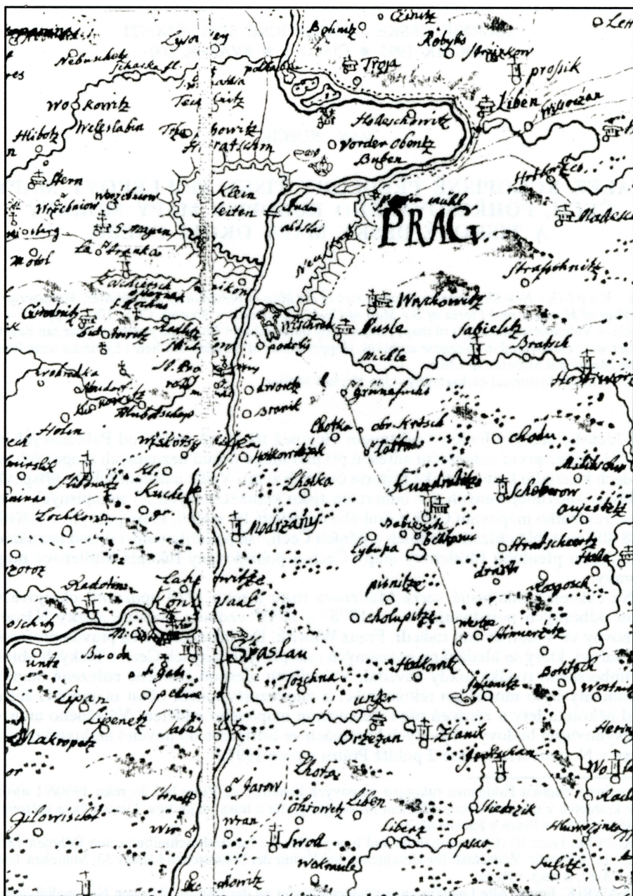
Obr. 1 – Praha a okolí na rukopisné předloze Müllеровy mapy Čech, 1714–1720.

Úřední doklady podle J. Honla 6) potvrzují, že Müller měl na příkaz České dvorní kanceláře ve Vídni zmapovat celé pohraniční území, tedy i za hranicemi Čech. Tento