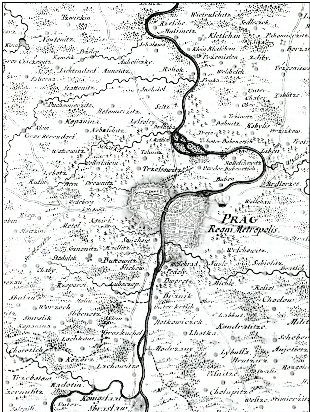
Obř. 2 – Praha a okolí na tzv. císařském exempláři Müllerovy rukopisné mapy Čech, c. 1718. Österreichische Nationalbibliothek, Kartensammlung, sign. aB55 A1.