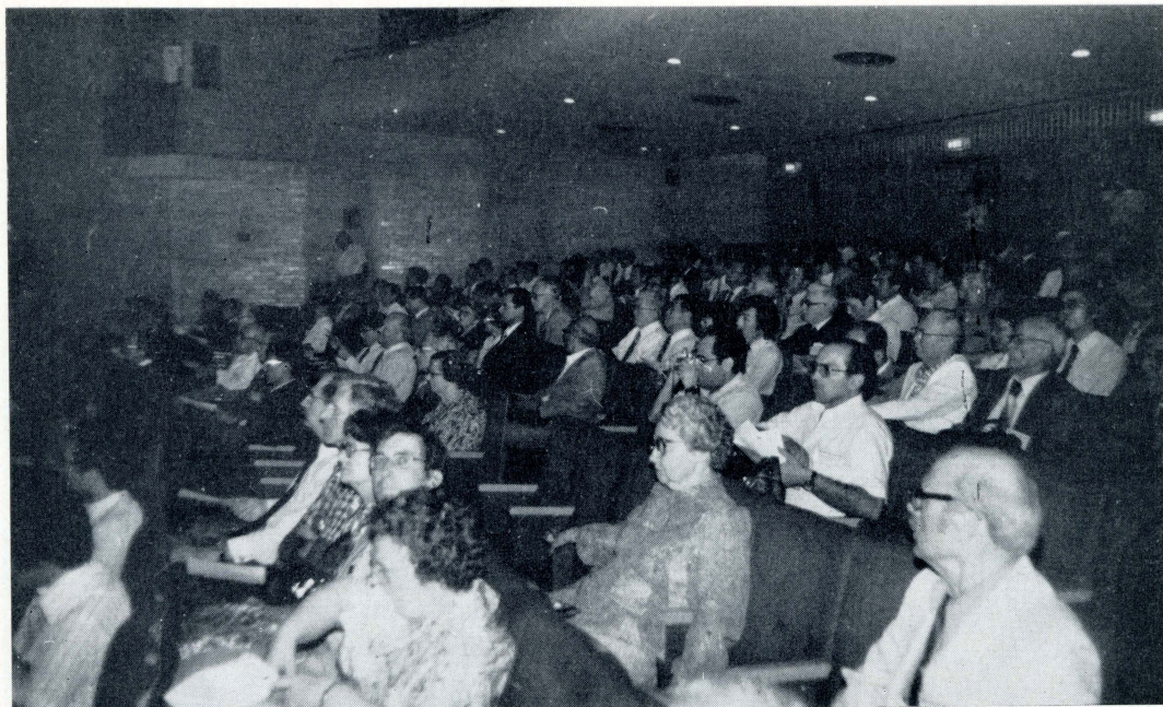
1. Pohled do sálu v Nippon Toshi Center v době valného shromáždění IGU.