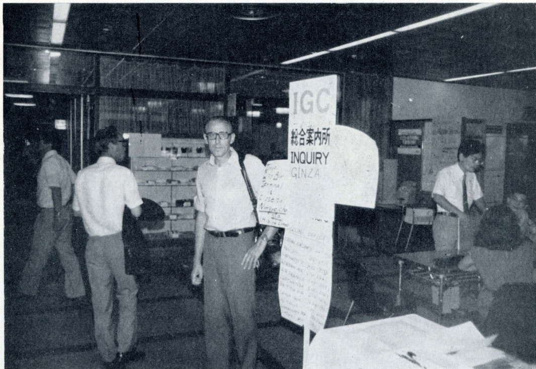
2. Čilý ruch v hlavním štábu kongresu v budově Nippon Toshi Center.