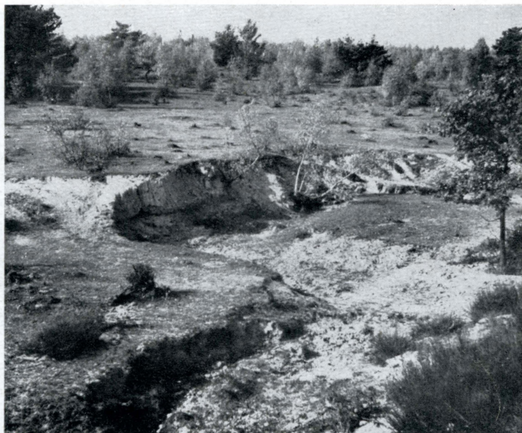
Obr. 5. Málo produktivní pasienkový les. Další intenzivní vypásání vede k urychlené erozi. Krajina se však dobře hodí ke krátkodobé rekreaci. Šterková terasa v Košické kotlině nedaleko Šace. (Foto P. Plesník.)