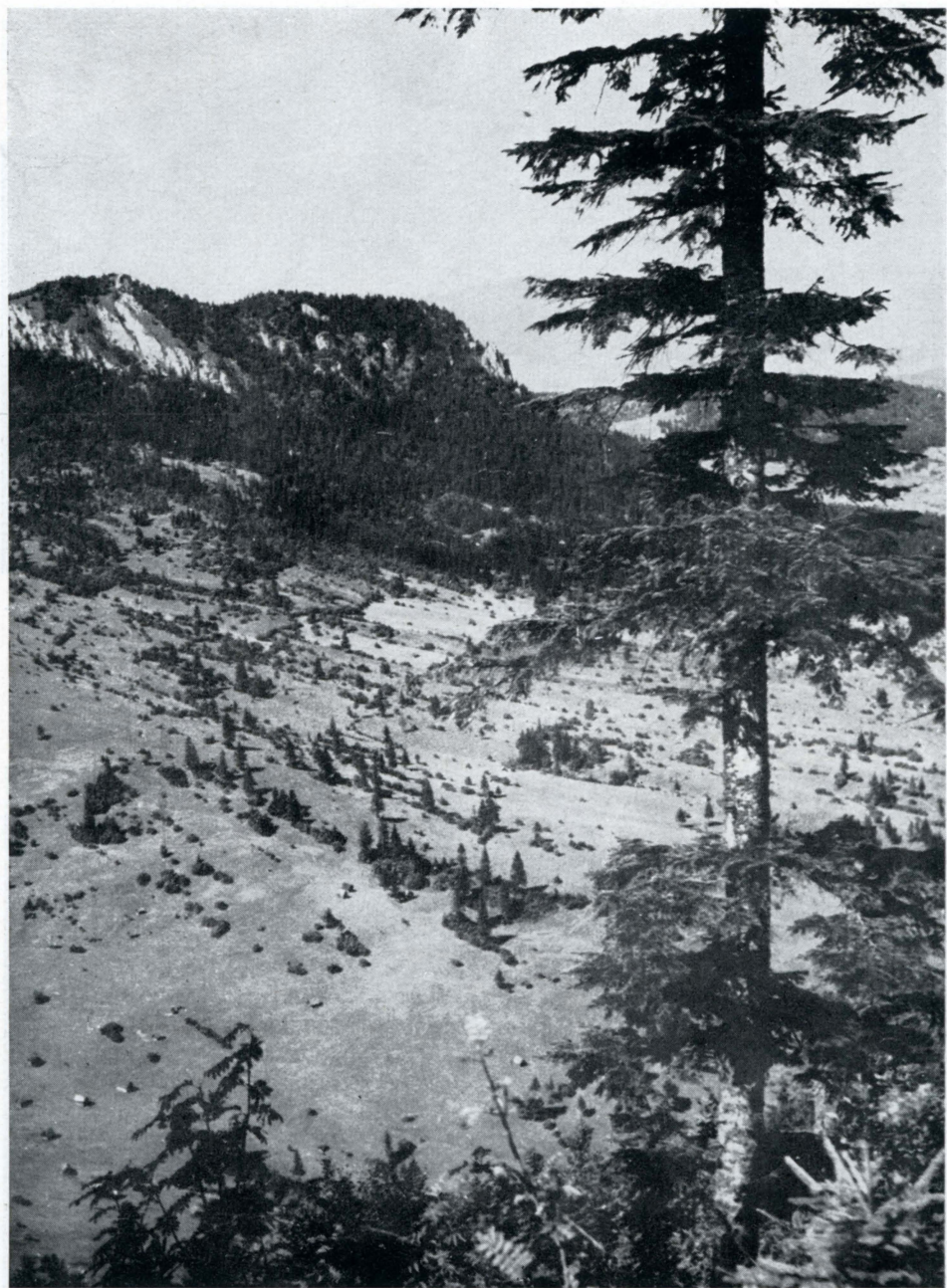
Obr. 8. Typ horské krajiny s vynikajícími přírodními vlastnostmi pro rekreaci. Chočské pohří.