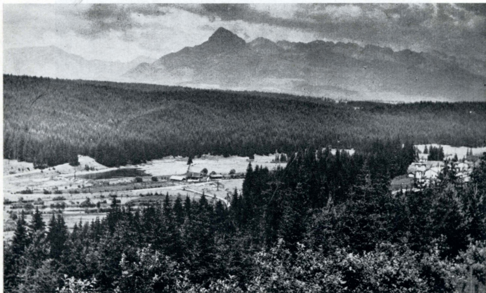
Obr. 1. Zalesněná horská krajina s vynikajícími kvalitami rekreačními a biologickými. Oblast Černého Váhu s částí Liptovských a Vysokých Tater v pozadí.

E. Hruška: Tvorba a ochrana krajiny jako životního prostředí.