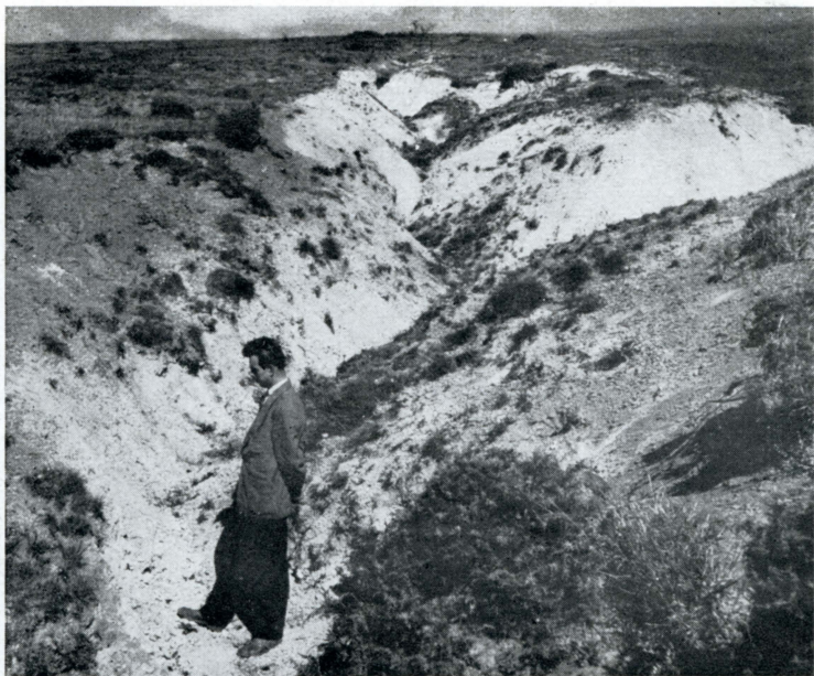
Obr. 3. Po devastaci vegetační pokrývky na tektonicky porušených dolo- mitech dochází k urychlenému vytváření erozních rýh. Tematinské kopce ve skupině Povážského Inovce.