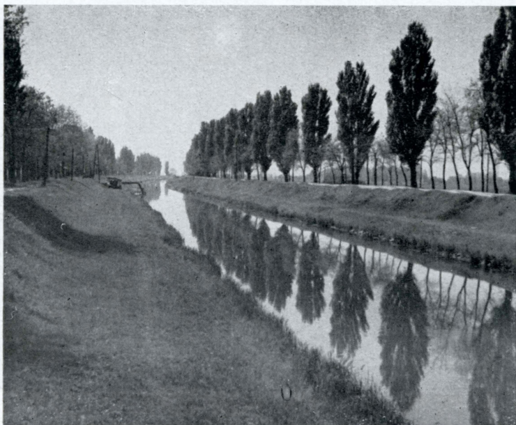
Obr. 6. Úpravu vodních toků je vždy třeba doprovázet zelení. Hlavní odvodňovací kanál na Velkém žitném ostrově u Okoče.