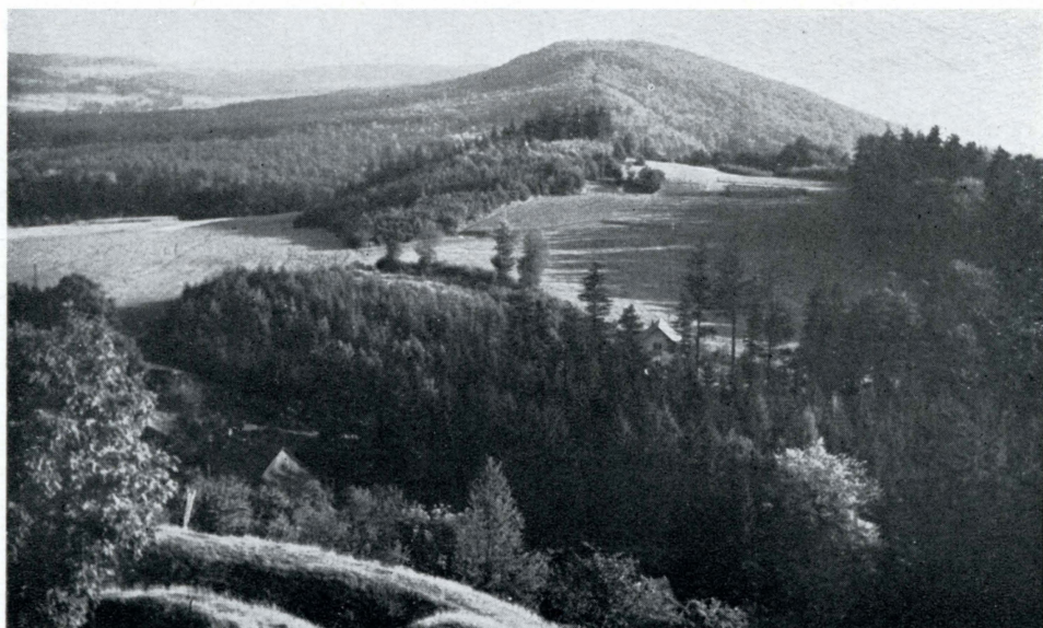
Obr. 9. Typ podhorské lesnaté krajiny s přímo vynikajícími vlastnostmi pro individuální a kolektivní pobyt v přírodě. Železné hory jižně od Lichnice.