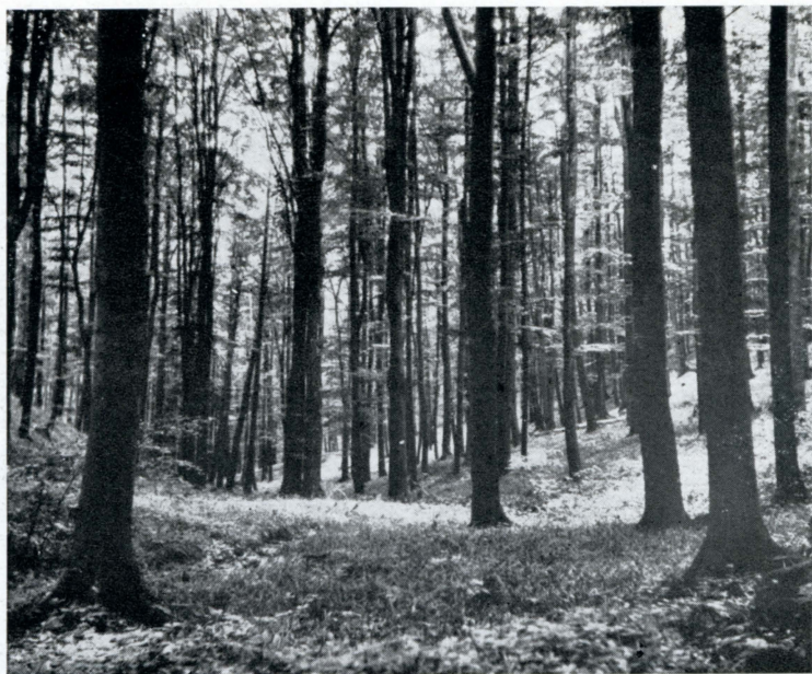
Obr. 4. Dobře obhospodařované lesy jsou důležitým článkem zdravé kra- jiny. Interiér vzrostlé bučiny v Malých Karpatech.