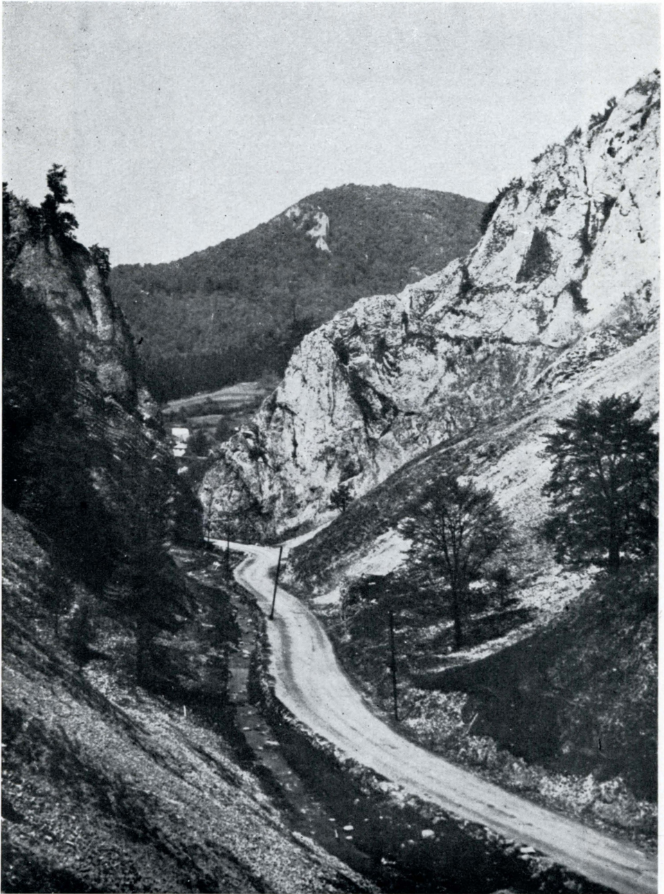
Obr. 7. V rekreační krajině záleží i na maličkostech, které lze snadno odstranit. Sloupy elektrického vedení snižují estetickou hodnotu krajiny. Kostelecká soutěska v připravované krajinné oblasti ve Strážovské hornatině.