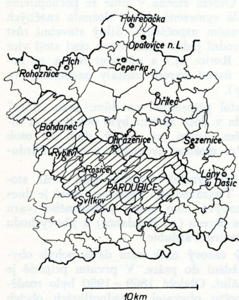
Území ovlivněné Pardubicemi.

Pardubičky, Nové Jesenčany a Studánka), a to proti roku 1869 vzrůst o 355 %, v roce 1869 měly 8 583 obyvatel, 1890 12 859, 1910 22 689, 1930 31 893 a 1950 39 080 obyvatel; na druhém místě, rovněž s velkým vzrůstem obyvatel je ovlivněné území se vzrůstem 118 %, v r. 1869 5469, 1890 5491, 1910 8577, 1930 10 028 a 1950 11 899 obyvatel. Nepatrně se zvětšilo naproti tomu obyvatelstvo zbývajících částí okresu, o 10 % — 1869 16 928, 1890 20 632, 1910 21 387, 1930 21 450 a 1950 18 694 obyvatel. Poslední období 1930—1950 dokonce vykazuje úbytek. Rovněž značné rozdíly jsou v rychlosti vzrůstu v uvedených třech oblastech (viz graf). Největší a vcelku i nejpravidelnější přírůstek obyvatel zaznamenávají Pardubice, kde se slučovala funkce politická, administrativní, kulturní i průmyslová. Menší pravidelnost pozorujeme u ovlivněného území, kde byl rychlejší vzrůst na začátku druhé poloviny 19. století, kdy začal být budován průmysl. Zbývajících částí okresu nese v posledních letech všechny charakteristické znaky oblasti s převládajícím zemědělstvím, na začátku mírný vzestup obyvatelstva, pak určitá stagnace nebo jen zcela nepatrný přírůstek a konečně pokles obyvatel.